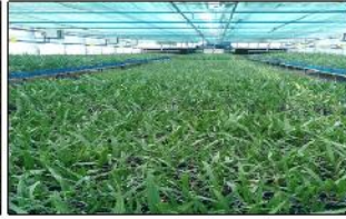
بازدید از شرکت کشت و صنعت رعنا جهت صدور گواهی سلامت ۱۲۰۰ اصله نهال کشت بافت خرما برای صادرات به کشور تایلند