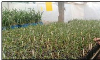
بازدید و نمونه برداری از ۴۸۰۰ اصله نهال کشت بافت خرما جهت صادرات به هندوستان