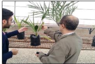
بازدید و نمونه برداری از نهال کشت بافت خرما رقم مجول از مرکز کشت بافت دکتر رستگار در حضور نماینده جهاد کشاورزی استان تهران