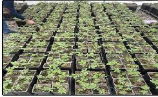
بازدید از شرکت کشت و صنعت رعنا جهت صدور گواهی سلامت ۲هزار نهال گردو تکثیر شده با روش کشت بافت