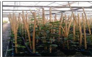
بازدید از هشت هزار نهال لیمو و نارنگی پایه ولکامرینا شرکت کشت و صنعت محیا جهت صدور گواهی سلامت