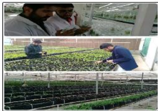
بازدید و نمونه برداری از گیاهان کشت بافت شرکت کشت بافت گیاهان دارویی آسیا