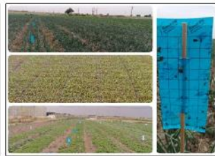
کنترل غیر شیمیایی آفات و بیماری های گیاهی مزارع و باغات استان البرز توسط کلینیک گیاه پزشکی دانشگاه تهران با همکاری شرکت فن آوری زیستی طبیعت گرا (بایوران)