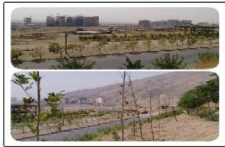
نظارت کلینیک گیاه پزشکی دانشگاه تهران بر فضای سبز پروژه هزار یک شهر واقع در محدوده دریاچه چیتگر